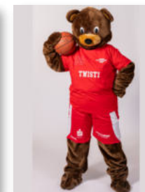
Twisti unser Maskottchen